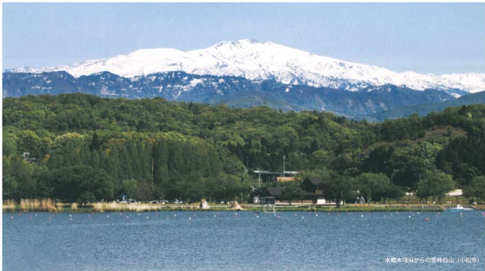
水郷木場湖からの雪峰白山（小松市）